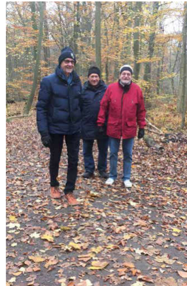
Drei lustige Wandergesellen