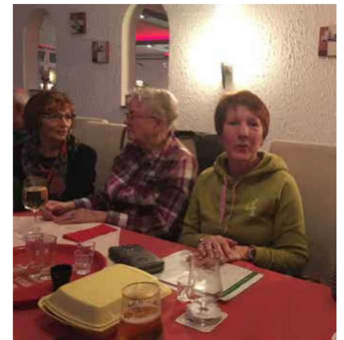
Bildunterschrift: In geselliger Runde