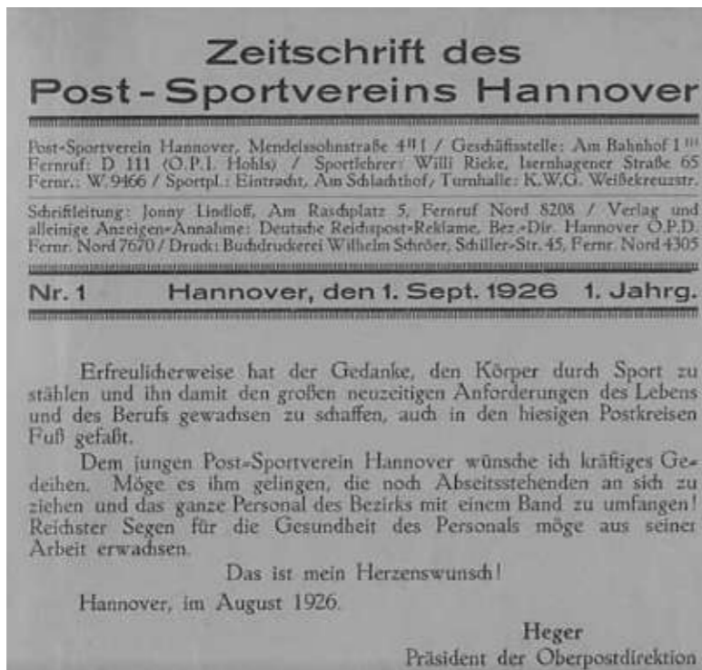
Auszug zur Vereinsgründung aus der archivierten 1. Ausgabe der Zeitschrift des Post-Sportvereins, die ab dem 1. Januar 1927 PSH-Nachrichten hieß

Ein erstes Sportfest fand bereits am 18. September statt, auch erste Sportabzeichenprüfungen wurden über die Zeitschrift des Post-Sportvereins vermeldet, die dann ab 1927 PSH-Nachrichten genannt wurde. Sigurd Moritz