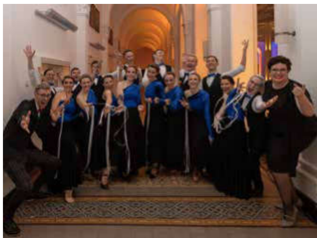
Gruppenfoto nach dem umjubelten Auftritt

Nach dem grandiosen Auftritt wechselten alle FormationstänzerInnen fix von der Auftrittsstelle in die Ballgarderobe, um mit den Gästen bis nachts um 2 Uhr zu feiern. Wer für den nächsten Internationalen Hochschulball Karten ergattern möchte, sollte schnell sein. Der Ball ist inzwischen so beliebt, dass die Karten für dieses Jahr innerhalb eines Tages ausverkauft waren.