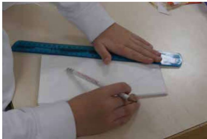
Servietten-Technik für Teelichter