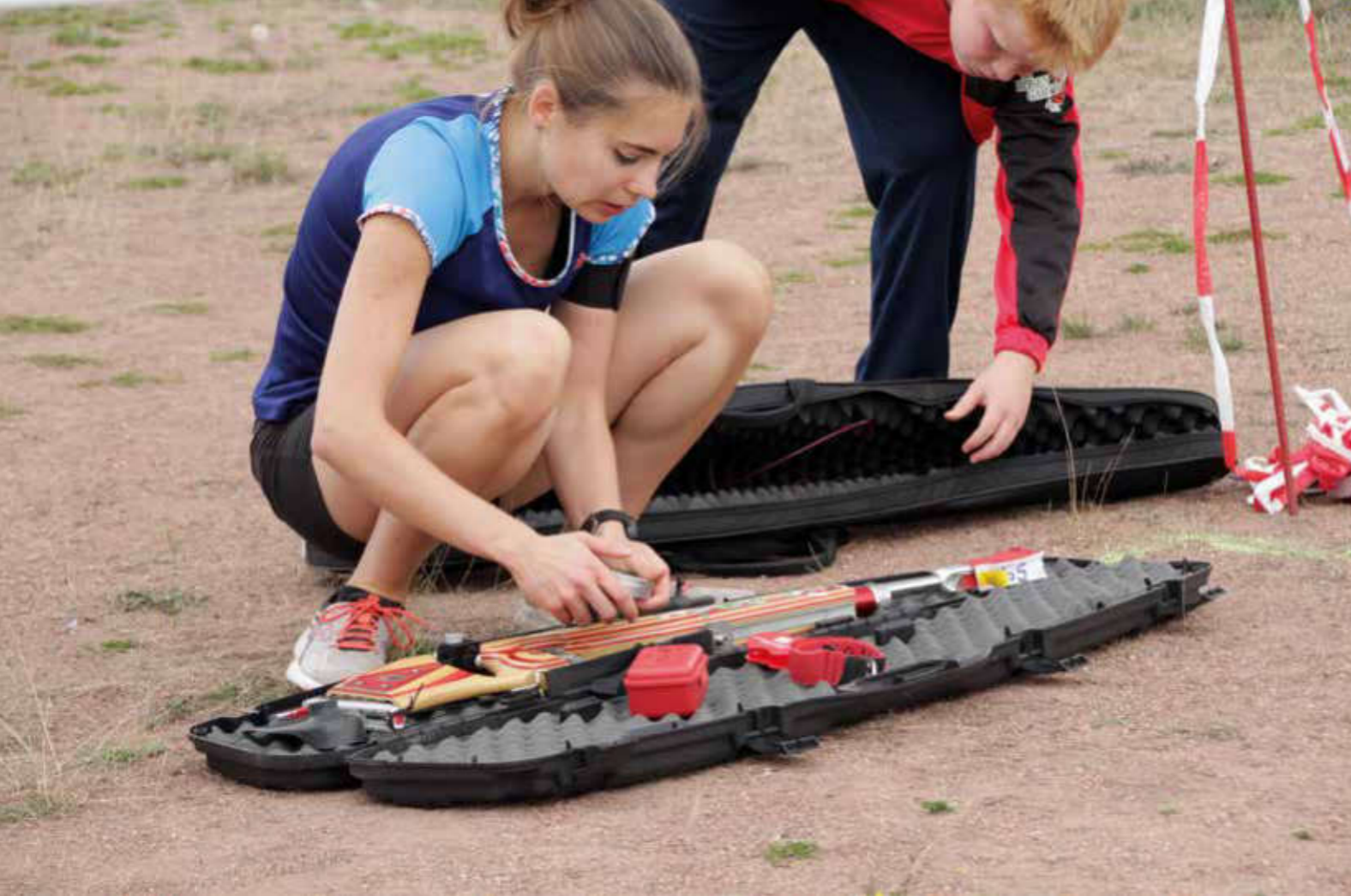
Vorbereitung zum Schießen beim Sommerbiathlon