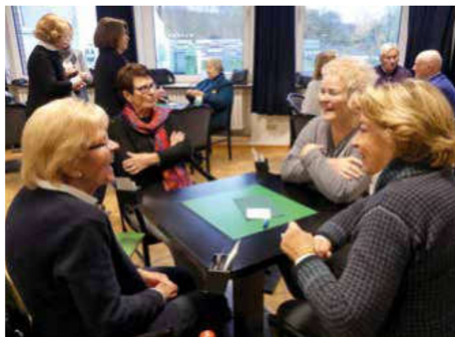
Fröhlich sein beim Bridge-Turnier