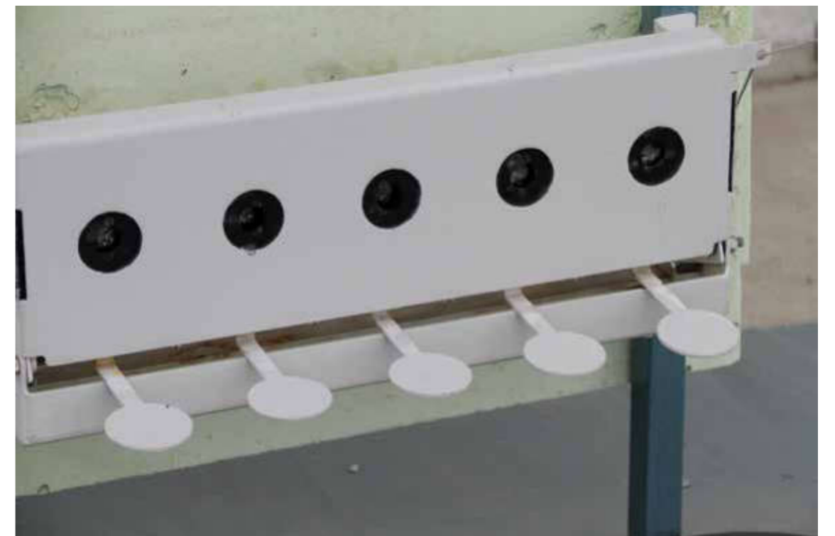
Klappscheiben, die im Sommerbiathlon eingesetzt werden