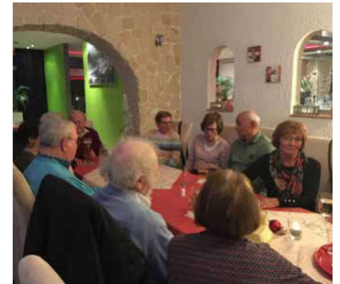
erst gemeinsam Wandern, um danach gemeinsam plaudern